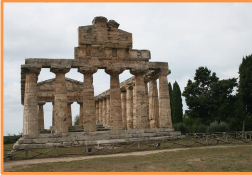
TEMPLE GREC. ITALIE : PAESTUM